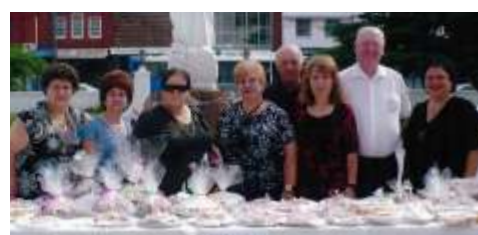
Biscotti regionali venduti per Bush Fire Appeal